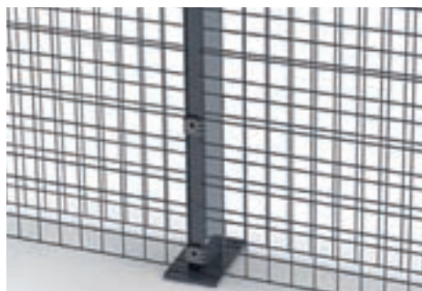
Les poteaux Zenturo avec plaque soudée (jusque h. 2,0m): disponibles sur demande