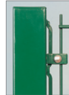
Bevestigingsstrip + specifieke bevestigingsklemmen