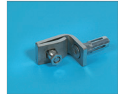
Verbindingsklem tussen poortpaal en afrosteringspaneel